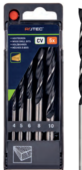
5-dlg. houtspiraalborenset in PVC-cassette Type 235 1x \varnothing 4, 5, 6, 8 en 10mm