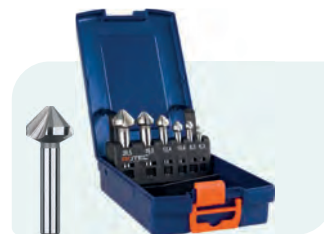
6-dlg. HSS-G verzinkfrezenset in ABS-cassette Type 400 1x \phi 6,3 / 8,3 / 10,4 / 12,4 / 16,5 / 20,5 mm