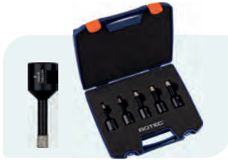
5-dlg. M14 diamantboorkronenset met wax, in kunststof koffer Type 757 1x ø6, 8, 10, 12 en 14mm