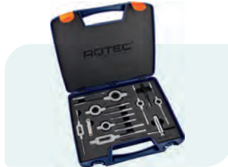
45-dlg. handtap- en snijplaatset, metrisch [M] in kunststof koffer M3, M4, M5, M6, M8, M10 en M12