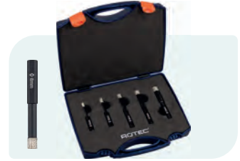
5-dlg. diamanttegelborensset met wax, in kunststof koffer Type 758.3 1x ø5, 6, 8, 10 en 12mm