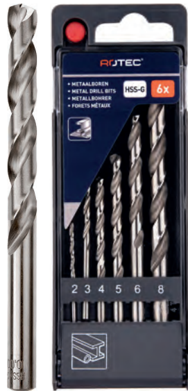
6-dlg. HSS-G spiraalborenset in PVC-cassette Type 105, geslepen 1x \varnothing 2, 3, 4, 5, 6 en 8mm