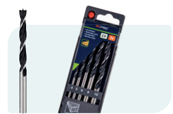
5-dlg. houtspiraalborenset in PVC-cassette Type 235 1x \phi 4, 5, 6, 8 en 10mm