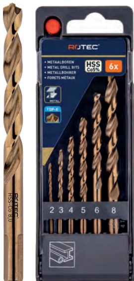
6-dlg. HSS-E spiraalborenset in PVC-cassette Type 116, geslepen 1x \varnothing 2, 3, 4, 5, 6 en 8mm