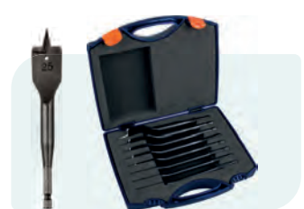
8-dlg. speedborensset Heavy-Duty in kunststof koffer Type 233 1x ø12, 14, 16, 18, 20, 22, 25 en 32mm