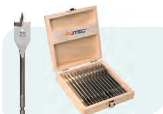
13-dlg. speedborensset in houten kist Type 230 1x ø6, 8, 10, 12, 13, 14, 16, 18, 19, 20, 22, 24 en 25mm