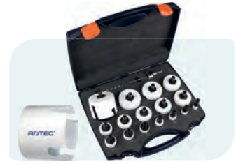
19-dlg. MP-gatzagenset met Quick-Change "Max" 6-knt. 11 Type 528 1x ø19, 22, 25, 29, 32, 35, 38, 44, 51, 57, 60, 64, 68, 76, 83 en 92mm