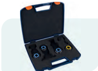
4-dlg. Starlock invalzaagbladenset (hout en metaal) Type 519 1x 519.0156; 1x 519.0178; 1x 519.0158; 1x 519.0166