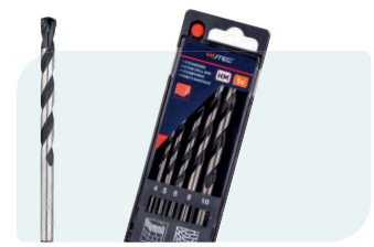
5-dlg. steenborenset in PVC-cassette Type 225 1x \phi 4, 5, 6, 8 en 10mm