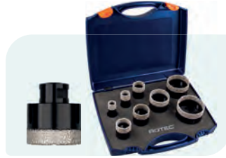
8-dlg. M14 diamantboorkronenset, in kunststof koffer Type 757 1x ø20, 25, 32, 35, 40, 50, 60 en 68mm