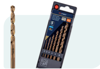
6-dlg. HSS-E spiraalborenset in PVC-cassette Type 116, geslepen 1x \phi 2, 3, 4, 5, 6 en 8mm