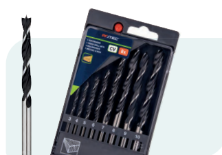
8-dlg. houtspiraalborensset in PVC-cassette Type 235 1x ø3, 4, 5, 6, 7, 8, 9 en 10mm