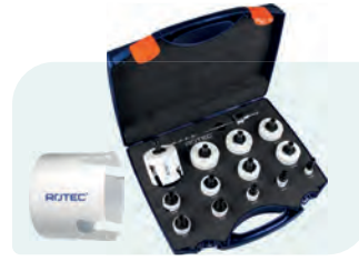
16-dlg. MP-gatzagenset met Quick-Change "Allround" 6-knt. 11 Type 528 1x ø19, 22, 25, 32, 35, 38, 44, 51, 57, 60, 64, 68 en 76mm