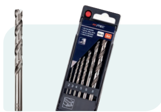
6-dlg. HSS-G spiraalborenset in PVC-cassette Type 105, geslepen 1x \phi 2, 3, 4, 5, 6 en 8mm