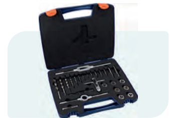
26-dlg. machinetap- en snijplaatset, metrisch [M], in kunststof koffer M3, M4, M5, M6, M8, M10 en M12