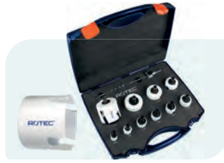
13-dlg. MP-gatzagenset met Quick-Change "Elektricien" 6-knt. 11 Type 528 1x ø22, 27, 32, 35, 38, 44, 51, 60, 68 en 76mm