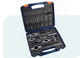
55-dlg. handtap- en snijplaatset, metrisch [M] in kunststof koffer M3, M4, M5, M6, M8, M10, M12, M14, M16, M18 en M20