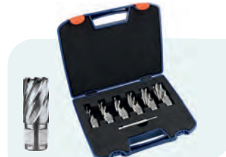
7-dlg. HSS kernborensset SILVER-LINE 30mm (Weldon), in kunststof koffer Type 536W 1x ø12, 14, 16, 18, 20 en 22mm