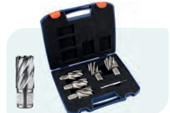
6-dlg. HSS kernborensset SILVER-LINE 30mm (Weldon), in kunststof koffer Type 536W 1x ø24, 26, 28, 30 en 32mm