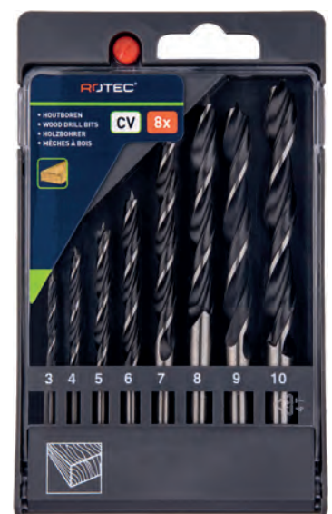
8-dlg. houtspiraalborenset in PVC-cassette Type 235 1x \varnothing 3, 4, 5, 6, 7, 8, 9 en 10mm