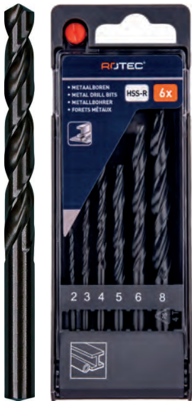
6-dlg. HSS-R spiraalborenset in PVC-cassette Type 100, rolgewalst 1x \varnothing 2, 3, 4, 5, 6 en 8mm

Diverse uitvoeringen in handige en compacte PVC-cassettes