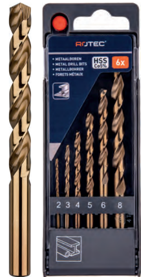
6-dlg. HSS-E spiraalborenset in PVC-cassette Type 111, geslepen 1x \varnothing 2, 3, 4, 5, 6 en 8mm