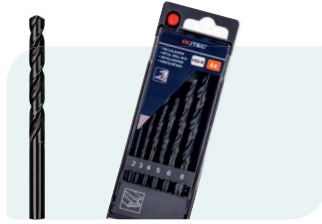
6-dlg. HSS-R spiraalborenset in PVC-cassette Type 100, rolgewalst 1x \phi 2, 3, 4, 5, 6 en 8mm