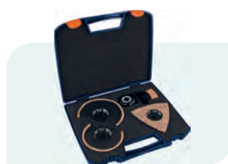
4-dlg. Starlock tegelset "Professional" (HM-Riff) Type 519 1x 519.0280; 1x 519.0146; 1x 519.0260; 1x 519.0270