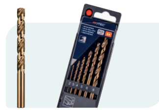
6-dlg. HSS-E spiraalborenset in PVC-cassette Type 111, geslepen 1x \phi 2, 3, 4, 5, 6 en 8mm