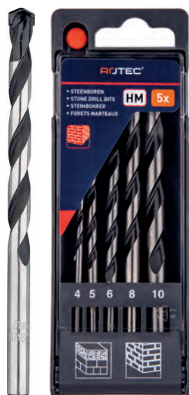
5-dlg. steenborenset in PVC-cassette Type 225 1x \varnothing 4, 5, 6, 8 en 10mm