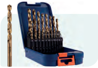
19-dlg. HSS-E spiraalborenset in ABS-cassette Type 116, geslepen 1x \phi 1 - 10 / 0,5\text{mm} oplopend