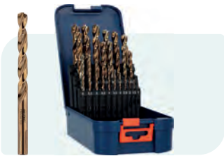
25-dlg. HSS-E spiraalborenset in ABS-cassette Type 116, geslepen 1x \phi 1 - 13 / 0,5\text{mm} oplopend