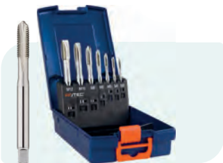
7-dlg. HSS-E OPTI-LINE machinetappenset, doorlopend, in ABS-cassette Type 'OPTI' (320): DIN 371: M3 - M10; DIN 376: M12