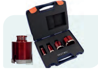
4-dlg. M14 diamantboorkronenset, PREMIUM, in kunststof koffer Type 757 1x ø25, 35, 50 en 68mm