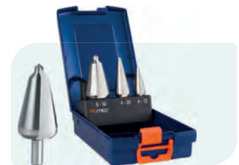
3-dlg. conische plaatborenset in ABS-cassette Type 420 1x Nr. 1, 2 en 3