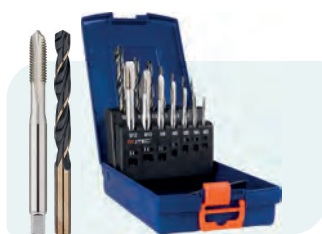
7+7-dlg. HSS-E machinetappenset, doorlopend, in ABS-cassette, 'OPTI' (320): DIN 371: M3 - M10; DIN 376: M12. 'PRECISE' (101) 1x \phi 2,5 / 3,3 / 4,2 / 5,0 / 6,8 / 8,5 / 10,2 mm