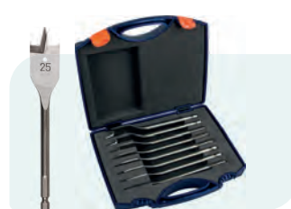
8-dlg. speedborensset in kunststof koffer Type 230 1x ø12, 14, 16, 18, 20, 22, 25 en 32mm