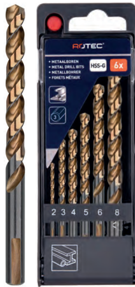
6-dlg. HSS-G spiraalborenset in PVC-cassette Type 107, geslepen 1x \varnothing 2, 3, 4, 5, 6 en 8mm