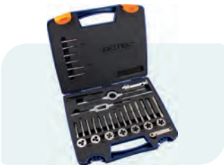
33-dlg. handtap- en snijplaatset, metrisch [M] in kunststof koffer M3, M4, M5, M6, M8, M10 en M12