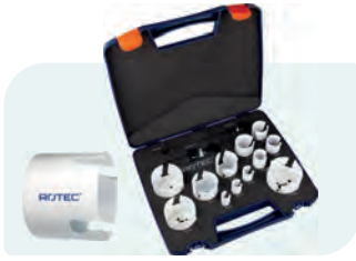
14-dlg. MP-gatzagenset met Quick-Lock "Allround" Type 528 1x ø19, 22, 25, 32, 35, 38, 44, 51, 57, 64, 68 en 76mm